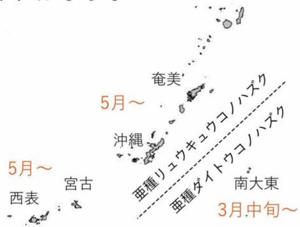
2亜種の分布と産卵開始時期