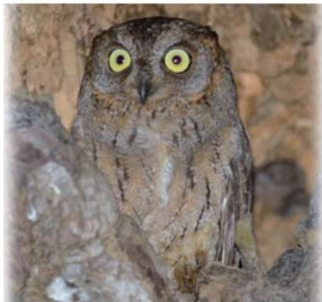
2016年南大東島 巣穴を守るオス