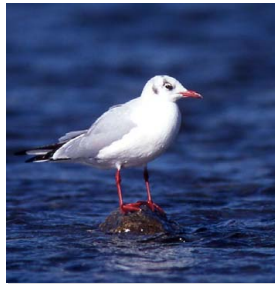
写真1. ユリカモメの成鳥冬羽。

雌雄同色。成鳥の冬羽は頭部が白くて、嘴は赤く、黒い瞳の後ろに黒褐斑がある(写真1)。夏羽は、頭部が黒褐色で嘴は暗赤色となる。幼鳥は、翼の上面に褐色味があり、嘴は汚黄色。成鳥の尾羽は一面白色だが、幼鳥の尾の先には細い黒帯がある。