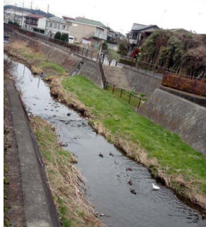
写真1. 程久保川でカルガモにまじって採食するコサギ。

自転車で府中から高幡不動の事務所まで、多摩川とその支流の程久保川を遡って通勤していると、カワウやサギ達に出会います。春から秋までは多摩川で見ることが多いのですが、1月ぐらいになってくると川幅5mほどの三面護岸の程久保川でも頻繁に見かけるようになり、コサギやダイサギが10羽以上まとまって採食している場面に出会うこともあります。魚の状況というのはなかなかデータがないのですが、多摩川の本流では魚が採りづらくなって、支流に餌を求めるようになるのではないかと、支流にやってくるカワウ達を見かけるたびにそんな考えが頭をよぎります。