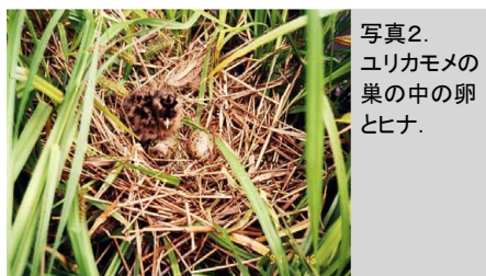
写真2. ユリカモメの巣の中の卵とヒナ。