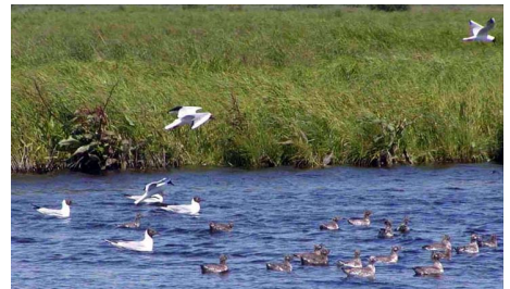
写真3. 夏羽の成鳥と湖に出たまだ飛べないヒナの群れ。カムチャツカのカムビツキ湖のコロニーで2005年7月9日に撮影。

繁殖地のカムチャツカへは5月中旬に姿をあらわし急速に個体数を増加させ5月下旬から6月にかけて産卵する。7月末にはほとんどヒナの群れ。カムチャツカのカムビツキ湖のコロニーで2005年7月9日に撮影。