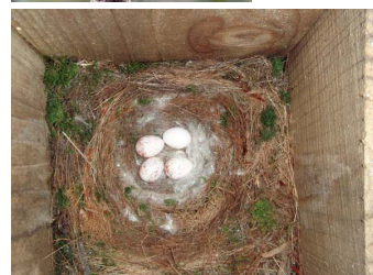
写真2. 温度ロガー付きの巣箱に営巣したヤマグラの巣と卵。右側の卵の隙間から温度ロガーが見える。