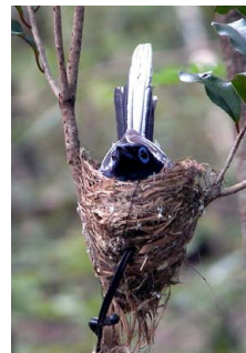
写真1. 温度ロガーを設置したマダガスカルサンコウチョウの巣と安心して卵を抱いている親鳥。