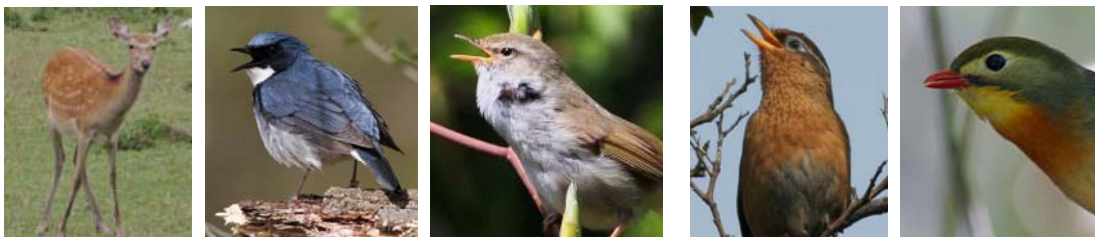
シカの増加により減少したコルリやウグイス

以前の調査から、早くも20年が経とうとしています。鳥たちの今を知るために、3回目の全国調査が必要な時期になっていますが、残念なことに次の調査を実施するための予算的な目処がたっていません。